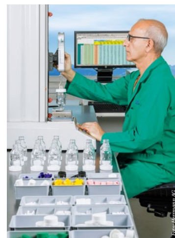
Zugprüfung in der Qualitätssicherung

Kosts Ruf zur Vorsicht bei zu schnellen Zeitplänen mag wahr sein, ist aber dennoch etwas gar zurückhaltend. Denn IQSoft ar-